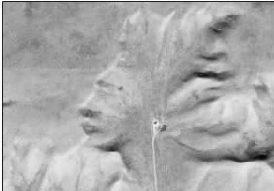
从卫星上看,位于加拿大境内的这座山就像一个印第安人头像