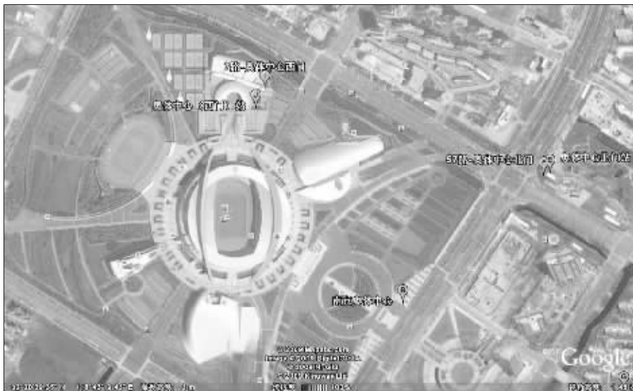
Google卫星地图上的南京奥体中心