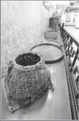
博物馆陈列各种生产工具