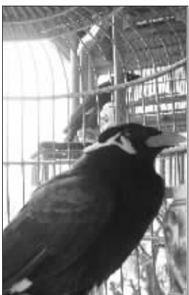
小家伙深得主人喜爱

袁师傅说,这只鹩哥从花鸟市场买回来五六年了,老两口平时没事时,会逗它讲话,“讲多了,它也会了,而且口齿还很清楚。”小鸟还“自学”了“接电话”,袁师傅指着旁边一只八哥说:“那只会讲话,但只会说‘你好’,口齿还没它清楚。”(陈先生报料奖60元)