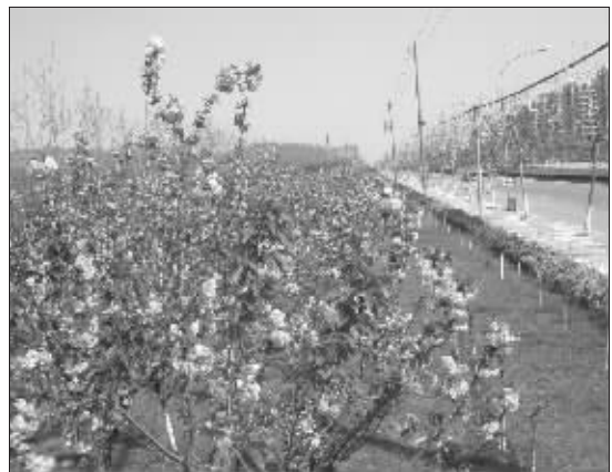
几条主干道上已种了近四万株特色树

“花境规划一共分8年,每年都在进行补种,比如樱花大道,每年都会补种800多米,现在已经形成2000多米的樱花走廊了,今年又多种了418棵樱花树,过几天正是樱花大开的时候,大家可以来看看。”雨花台区建设局绿化办公室郝工程师告诉记者,这九条主干道上已经种植了近四万株鲜花,其中樱花4000多株,八月桂3000多株,月季10000多株,玉兰近千株……“目前正在对花神大道等6条道路进行提档升级,上个月花神大道上又种了661株紫薇和418株樱花,其他几条道路的绿化工作也已经全面启动了。”到5月底,除了宁溧路和宁丹路部分路段,绿化工程将全面完成。