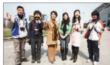
快报组织的莎拉“粉丝团”