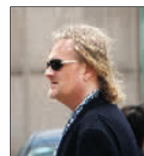
要打记者的跋扈随从