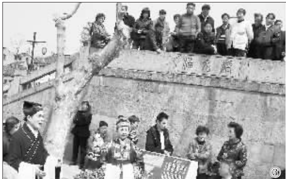
①②仿古游船弋河上 ③在清名桥桥头唱戏、看戏成为当地一景

昨天,清名桥古运河水上游正式启动,这也宣告了历时16年历经6轮规划编制,1年多时间修复的清名桥古运河历史文化街区正式“开门迎客”。全长1700多公里的京杭大运河跨越四省二市,沟通五大水系,其中无锡南长段最具原生态风貌,历史最悠久,保存最完整,被誉为“江南水弄堂”,是当之无愧的中国运河“绝版之地”。从上世纪90年代初清华大学为无锡清名桥历史街区规划保护范围开始,无锡市政府邀请多所知名院校、著名专家对清名桥历史街区进行了历时16年6轮反复