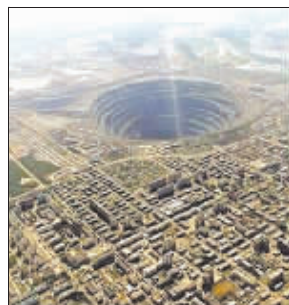
米尔内钻石矿场的大洞

察,意外地发现了这一地区蕴含丰富的钻石资源。随后,地理学家的发现成为前苏联的一项国家级绝密项目,政府为此花费了大笔银子。这里和附近的几个矿场贡献了占全球总量23%的钻石。