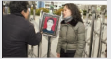
孩子家人在学校门口哭诉

随着日前家属和校方签订的“协议”生效,这起高中生死亡的事件也已告一段落,但其中反映出来的问题发人深省。