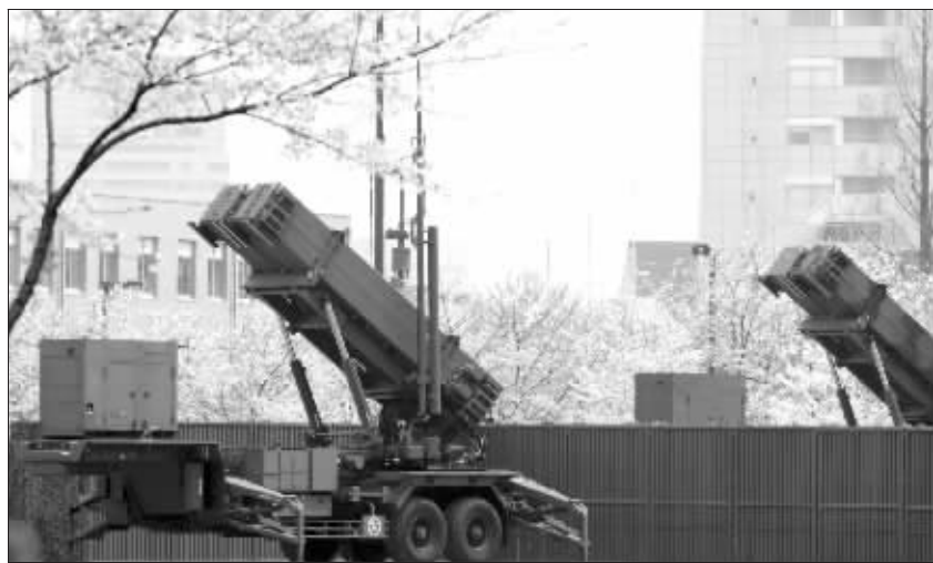
4月4日,改进型“爱国者”拦截导弹发射器被部署在位于东京的防卫省总部。

而4日中午12时16分,日本官方的危机管理中心用电子邮件向媒体发布消息,称朝鲜已经发射飞行器。日本政府5分钟后发出“误报”更正。