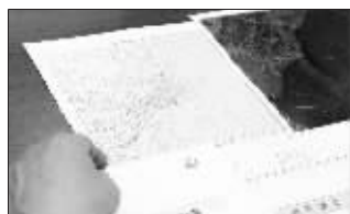
4月4日,一名韩国外交部官员在首都首尔举行的紧急会议上察看地图,商讨针对朝鲜发射卫星的应对措施。