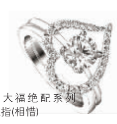
周大福绝配系列戒指(相惜)

选戒指,我还是信任老百货,价格先不谈,老百货的珠宝质量肯定是有保证的,要不然也会砸自己的招牌啊!问了报社里几个南京土生土长的MM,她们都建议我去去山西路百货大楼选戒指。那里的周大福是香港在南京的第一直营店,质量不用烦了!