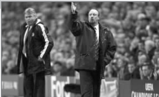
希丁克(左)面前，贝尼特斯栽了

希丁克最神奇的表现就是使用了伊万诺维奇，其实即便是博辛瓦受伤，切尔西在右后卫位置上还有一度占据主力位置的贝莱蒂以及小将曼西恩，而伊万诺维奇其实是一名中后卫，有时候也客串后腰，但是打右后卫的机会并不多。希丁克却很坚决地选择了伊万诺维奇，看中的就是他的头球能力，事实上，兰帕德在赛后也透露，希丁克在决定派上伊万诺维奇之后，就专门围绕塞尔维亚人制订了好几套定位球战术。