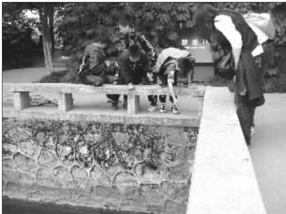
孩子们正在“钓”池中硬币

据读者反映,在红梅公园红梅阁西侧有一个放生池,是专供人们放生水生动物的。可有些善男信女认为把硬币扔进池里会给他们带来好运气,因此时不时有人往池中扔钱,其中大部分是一角的硬币,也有5角的和一元的。见池中有钱,一些顽皮的孩子就想设法去捞,由于放生池离地面有3米多深,这些孩子就用塑料绳扎上吸铁石,抛到池中来回牵动,池中硬币碰到吸铁石就能被吸上来。