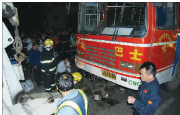
消防队员在现场努力将被害者尸体移出。

围观市民看到这一惨景,一个个大骂驾驶员。“这样的驾驶员,应该拖了枪毙!”“太惨了!太惨了!不敢看!”120救护车赶到现场,却发现车下的人早已死去。一辆消防车随即赶到现场,将死者从车轮前拖出。这名男子右边脑袋和手臂几乎没了。警方目前正在调查此事。