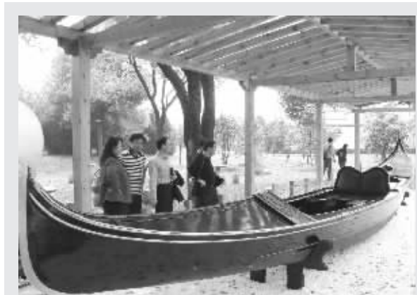
意大利威尼斯赠送的贡都拉