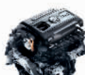
TSI涡轮增压直列四缸发动机