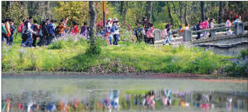
近日,阳光明媚,南京东郊风景区迎来了学生春游高峰

昨天 苏南气温暴涨,全省多地出现30℃以上的“高温”,南京也出现了今年的最高温。“冷空气的到来很‘曲折’,往往是先把气温抬高,然后哗一下降个10℃”,专家称。昨天,南京最高气温达到了29.3℃,局部突破30℃,就属于冷空气影响的前期表现,后面紧跟着的就是大幅降温。