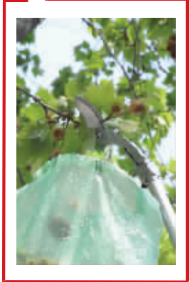
“果球采摘器”用起来挺方便

一汽-大众汽车有限公司 吉林 长春 东风大街 邮编:130011 www.faw-vw.com 客户关怀热线:4008-171-888 (0431) 85990888