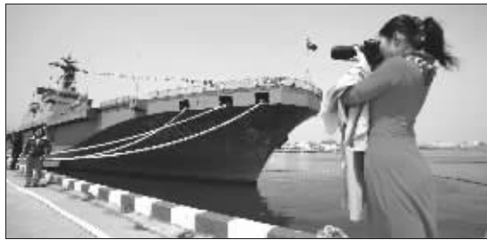
多国军舰向公众开放,游客正在韩国“独岛”号前留影。