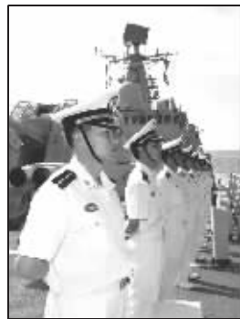
我海军人容整