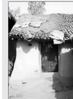
卡琳迪家只有一间小屋,家徒四壁,家里没电、没水也没有卫生间