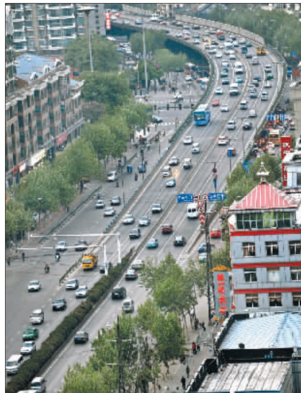
清凉门高架汉中门段,车流缓缓移动

据悉,城西干道高架桥从北向南依次分属交警六大队、五大队、二大队、三大队管辖,除大桥南路高架部分路段为双向两股车道外,大部分高架桥路段均为双向四股车道,而且还有三处S形弯道。“双向四车道,单向仅有两股车道,一旦发生事故,就算是小小的追尾碰撞事故,至少也要占据一股半车道,相当于整条道路被堵死!由于缺少应急车道,警车、拖车常常上不去。”长期在草场门高架桥附近执勤的交警告诉记者,每天早晚高峰,这座高架桥就成了重点保护对象,“千万不能出事,否则就完蛋了!”但交警的胆战心惊根本无法阻止事故的发生,往往是越担心,事故越多。跟草场门高架桥相似,北面的定淮门高架桥,南面的清凉门至汉中门高架桥、水西门高架桥甚至集庆门隧道,都是事故高发路段,“换句话说,城西干道的通行能力,其实相当脆弱!”