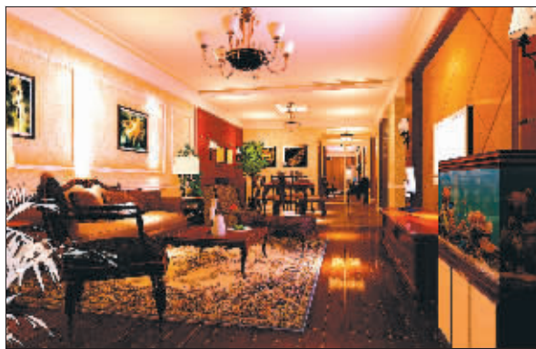
龙发装饰设计作品

5月2日,由现代快报主办的第三届京派高品质家装品鉴会又将在金陵饭店隆重举行,届时,您将再次领略京派设计大师们的风采,还可以一睹由快报《居家》周刊编撰的《新编家装三十六计》。此外,南京市装饰行业管理办公室投诉处理中心将在现场设立投诉受理点,接受消费者投诉。