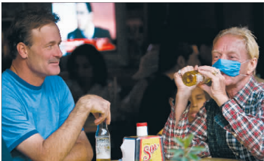
4月25日,在墨西哥城的繁华地区,游客戴着口罩用餐、饮酒。