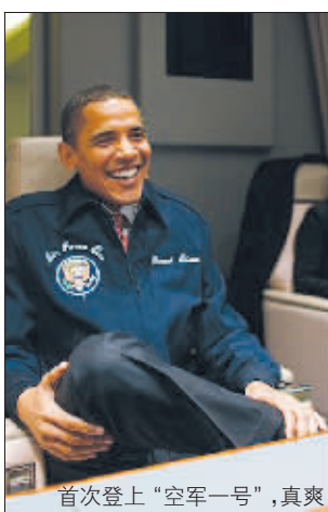
首次登上“空军一号”,真爽