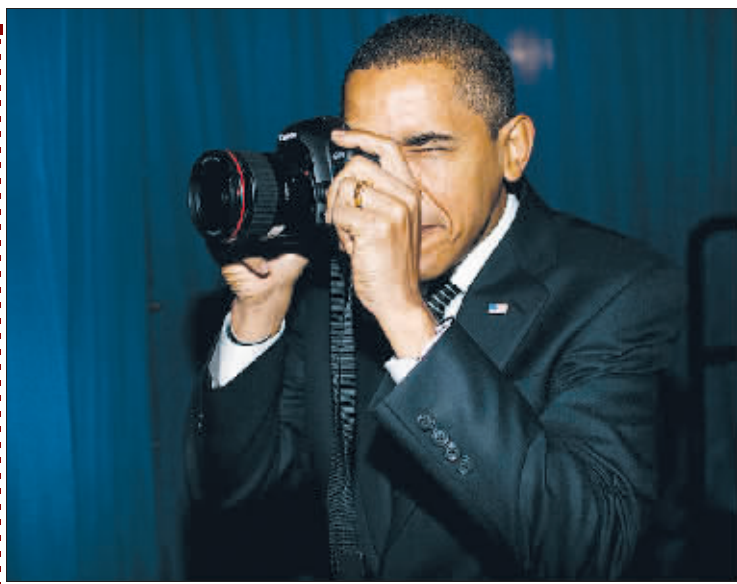
↑聚焦!在亚利桑那州拍照

据最新民调显示,奥巴马在执政近百日时的民意支持率创20年内新高,有超过半数的美国民众认为他正带领国家走上正确轨道。英国媒体称,白宫还没有一个总统能像奥巴马这样充分利用照相机的价值,通过他以及家人的照片来“赢得民心”,这也许就是“美国第一家庭为什么在百天后仍然那么受欢迎”的原因吧。 中国日报 李卉