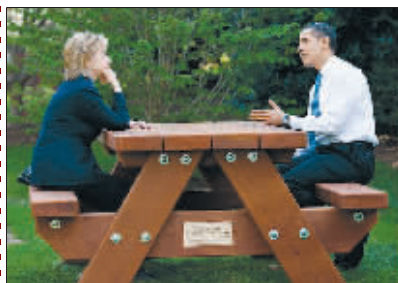
↑与国务卿希拉里在白宫草坪上亲切交谈