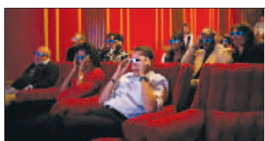
↑戴上3D眼镜与朋友们一起观看橄榄球超级杯大赛