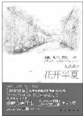
九夜茴 著 东方出版社友情推荐

魏如风摇摇头,说:“我不抽烟。”程豪笑了笑,又点了一根,塞在魏如风的嘴里说:“男的哪有不抽烟的?这是万宝路,抽抽看。”魏如风吸了一口气,有点咳嗽,茫然地看着程豪。程豪站起来,背对着他们说:“周四早10点,你来东歌夜总会找我。老钟,你把这里收拾收拾,弄干净点,我最讨厌这种事情。”