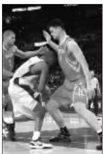
他的膝盖撞向姚明右膝