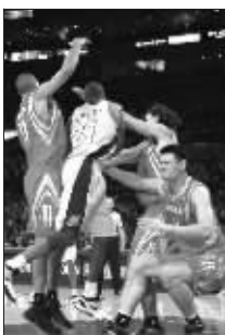
姚明支撑不住倒下