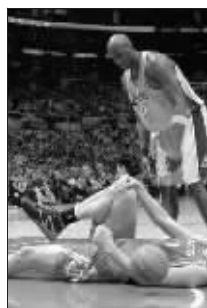
姚明痛苦地捂住右膝