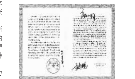
航天英雄亲笔签名的出品证书