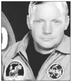
1969年时的阿姆斯特朗

在美国宇航局准备庆祝人类首次登月40周年纪念日之际,一本将于5月7日出版的新书《飞向月球》首次披露了一个鲜为人知的内幕:当“阿波罗11号”飞船抵达月球时,由于“鹰”号登月舱燃料箱漏气,导致登月舱飞向月球速度过快,差点坠毁在巨岩和乱石上。所幸的是,阿姆斯特朗临危不乱,在登月舱燃料耗尽前30秒及时找到安全着陆地点,驾驶登月舱成功地降落月球表面。