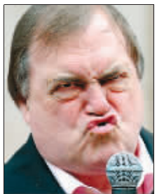
普雷斯科特挤眉弄眼,模仿布朗的“可怕”微笑