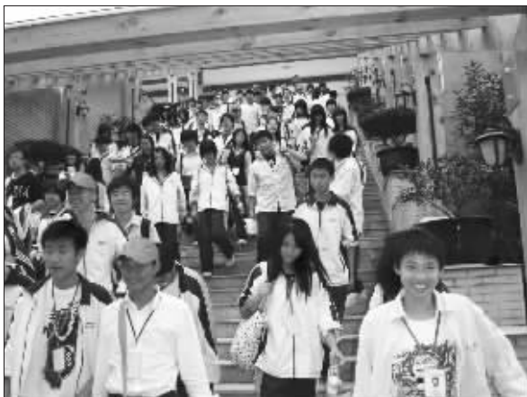
国际高中部中外学生

普通班、强化班招收应届初三毕业生以及少数高一学生,计划招收4个班共100人。学校每学年学费为5万元人民币,一年住宿费1400元人民币,伙食费、书本、服装费、卧具费、医疗费按实收取。