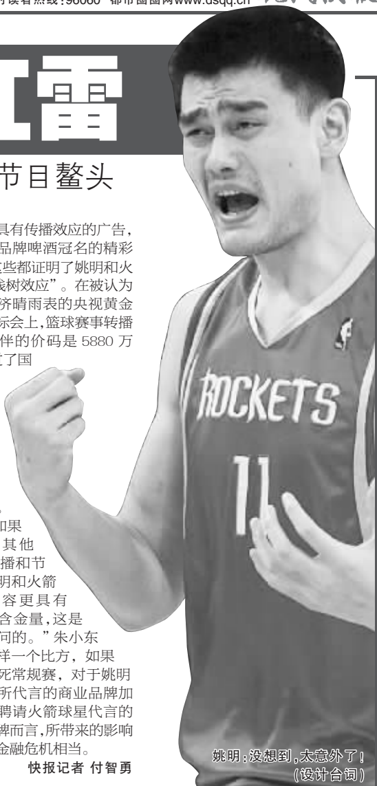
姚明:没想到,太意外了! (设计台词)