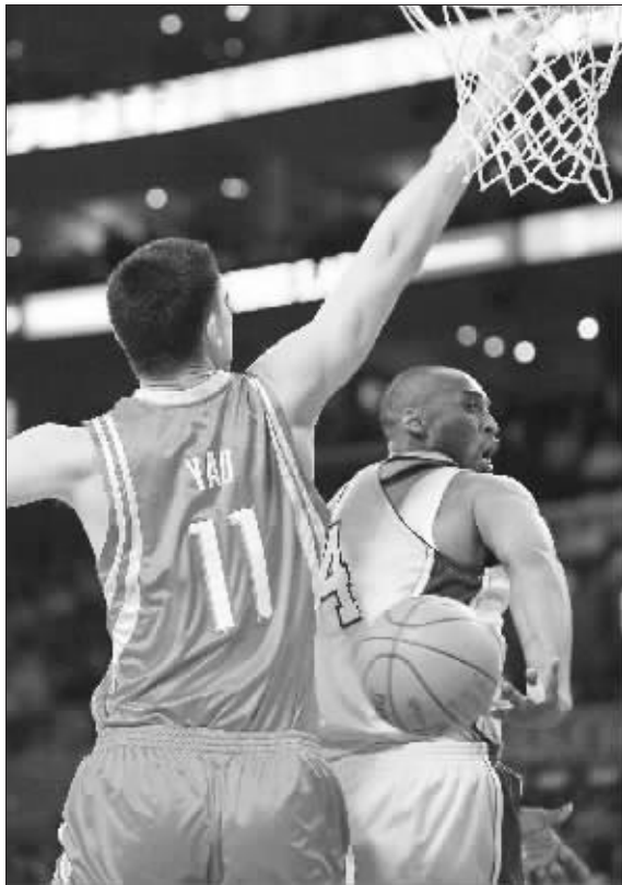
姚明要当心科比的小动作

强大的三角进攻战术,阿德尔曼总能挖掘出火箭的潜力,祭出一些出其不意的战术,令湖人措手不及。在前天比赛中,火箭的替补联手砍下30分,湖人替补只有22分进账,尤其是在湖人凶猛的气势下,火箭替补方寸不乱,体现了火箭的板凳深度。与此同时,阿德尔曼采用了洛瑞和布鲁克斯的双控卫战术,年轻的兰德里则成为火箭奇兵,火箭小、快、灵的阵容,给湖人带去不小麻烦。