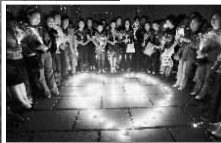
汶川,南京为你点盏灯