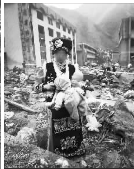
羌族女子正祭奠亲人