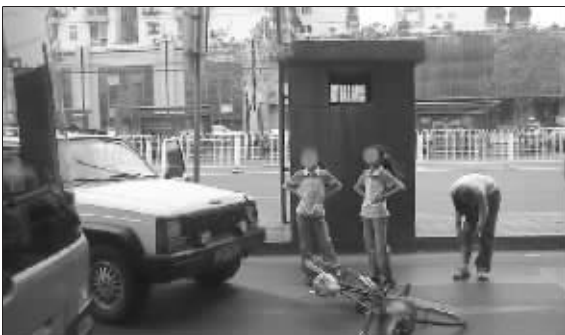
双胞胎姐妹叉腰大骂,被撞MM自顾察看伤情

据统计,四川地震灾区共有100多万名小学生。2008年,该项目捐助的4265名小学生实际上仅占灾区小学生总数的4%。因此,中国扶贫基金会再次携手百胜餐饮集团发起“捐一元,献爱心送营养——全国爱心公益传递行动”,南京站的活动将于6月初正式启动,届时大家可以到百胜餐饮集团旗下肯德基、必胜客等餐厅现场参与捐款。