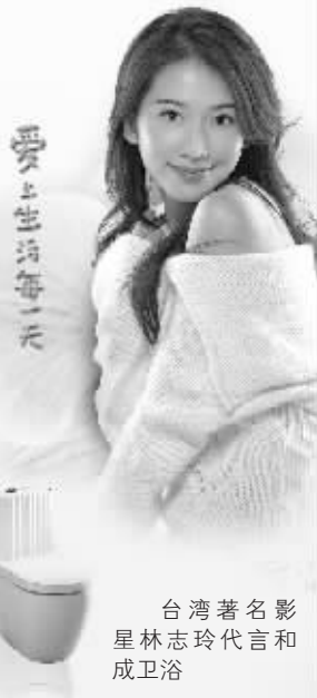
台湾著名影星林志玲代言和成卫浴

由快报家装俱乐部打造的家装建材春季团购会,明天将开往和成卫浴。由于本次团购活动是和成卫浴在南京首次举办类似活动,商家拿出了相当可观的优惠资源:除了有各种特价产品(比如原价1900元的分体马桶,最低只要299元),只要现场每有80名读者签单,和成卫浴就将送出一个一等奖名额——台湾8日豪华游。