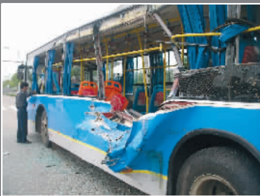
公交车车厢中部被撞出大窟窿

包括货车司机在内, 事故共造成11人受伤, 其中两人伤势较重, 伤者多为在校大学生。