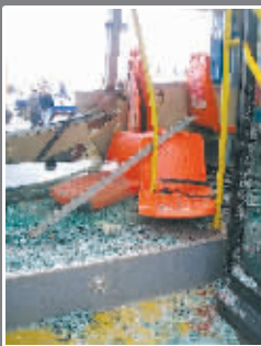
公交车厢里惨不忍睹