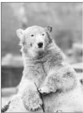
一周岁生日时的“克努特”

2006 年 12 月，母熊“托斯卡”产下“克努特”和它的孪生兄弟，但却将它们遗弃，