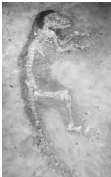
纽约自然历史博物馆展出了具有 4700 万年历史的灵长类动物化石“艾达”

但也有部分研究人员对其与猿类和人类祖先“密切相连”的观点持不同看法。“事实上，我并不认为那与猿、类人猿和人类的共同祖先存在十分密切的关联，”美国匹兹堡卡内基自然历史博物馆研究人员克里斯托弗·比尔德说。