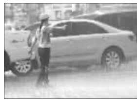
最美女协警在雨中指挥交通

5月20日傍晚6时左右,突然降临的大雨让广东惠州的市民措手不及,原本拥堵的交通更加混乱。在市区南坛路口执勤的女协警顾不上穿雨衣,大雨把她的警服完全浸透紧贴在了身上,依然忙碌着指挥着交通。这雨中感人一幕被一位市民拍下,并上传到网络上,网民对这位女协警交口称赞,纷纷赞其为“最美女协警”。