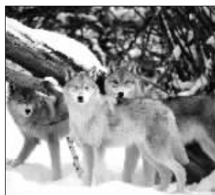
狼群严守“道德规则”

不过,动物们的确具有一些我们人类才有的心理特征,譬如同情心、互惠精神、合作愿望与和平共处精神等。人类的道德感不是无中生有产生的,而是来自我们灵长类动物的心理状态,我们的心理状态拥有远古的起源,但我承认,其他许多动物仍然拥有和人类同样的心理倾向,以及强烈的社会性。” 欧阳