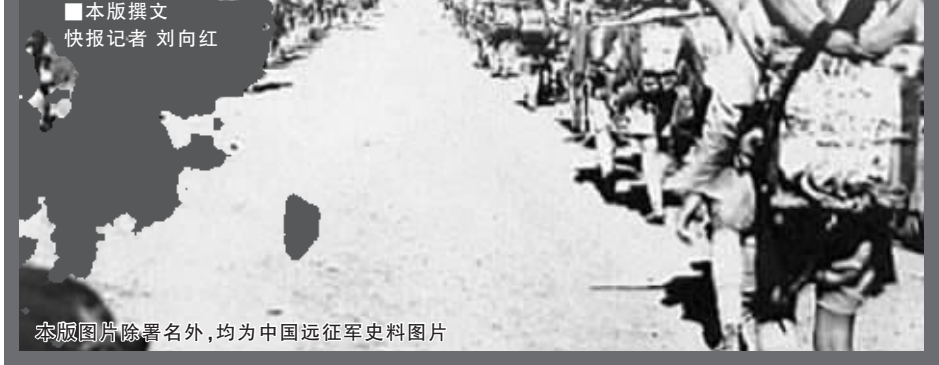
▲本版撰文快报记者刘向红