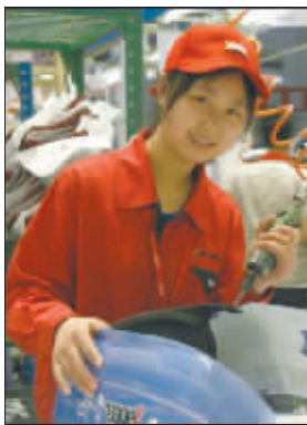
在网上红极一时的“某电动车女孩”和招聘二奶广告

上个月,无锡在网络上的名声可不小。先是有“网友”发帖要求人肉他喜欢的某工厂美少女,没过几天一则“校园门口急聘二奶”的消息又上了各大网站的头条。还没等事件平息,又一个古怪招聘试题竟让人跳楼的帖子开始在网上传。因为上述3则雷人新闻的发源地似乎都在无锡,一时间不少网民都把目光投向了这个地处苏南鱼米之乡的城市。有细心的网友在网络纷纷转载雷人新闻的同时,发现了其中的疑点——3则雷人新闻中均提到了无锡某电动车公司。会不会是这家电动车公司在炒作自己?对此《生活无锡》进行了调查。