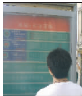
至今不肯退休的站牌

无锡市交通场站建设管理有限公司的一位工作人员解释,整个无锡市的公交站牌正在更新换代,将由原本绿色底的公交站牌更换成白色