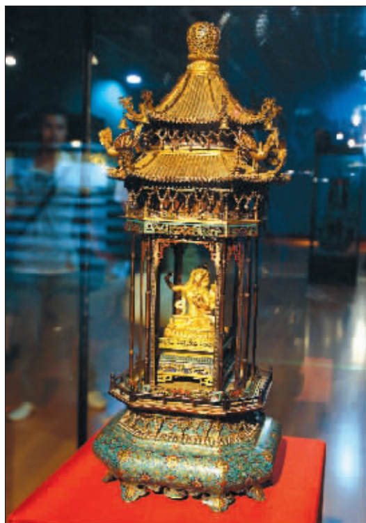
铜胎掐丝珐琅佛龕

在展厅现场,一个金光闪闪的珐琅佛龕引起了大家的注意。佛龕名叫“铜胎掐丝珐琅佛龕”,造型奇特,最上面是一个鎏金的大屋顶,正中间一个金光闪闪的佛祖盘坐着,下盘是个铜胎掐丝珐琅。