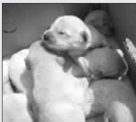
▲小宝宝们还没睁眼 ▶小金毛在喂奶