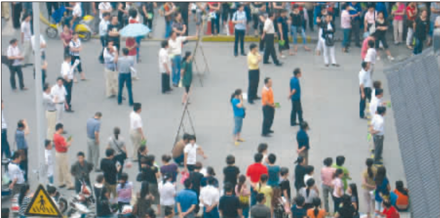
江南中学门口挤满等待考生的家长