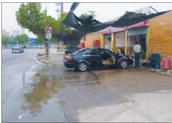
金城桥北匝道的违规洗车点

昨日上午11:00左右,《生活无锡》在金城桥北匝道看到,这里有两个洗车点正在忙碌着。洗车点就位于金城桥北匝道和运河东路的交界处,一名年轻男子手拿着喷水器清洗一辆黑色的轿车,水花四处飞溅,最高的地方能有3米。有小部