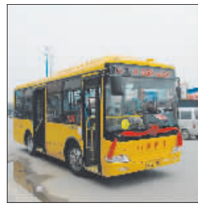
黄色小区巴士成为锡城新的风景线(上图),但公交站台边上就是隔离栏,上车还得先“跨栏”,让人觉得不大方便。

人行道上,本来就不宽敞的人行道被宽度1米多的站牌“拦腰而截”,连盲道也被部分占据。在站台附近,非机动车道和机动车道被一整段隔离栏隔断,想要乘坐公交车,还得先过隔离栏这一关。