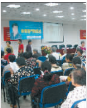
还没开讲会场就坐得满满当当

据悉,《癌症只是慢性病》在新华书店上柜后,平均每天都能销售近50本,活动当天更是卖出了近千本。金辰 陈超