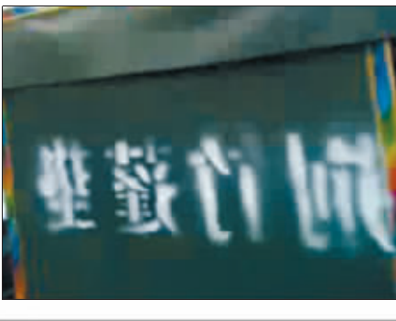
←图三:三轮车上的字是反的