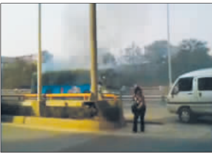
←图二:第一个逃生女