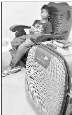
小孩躲在行李箱欲偷东西