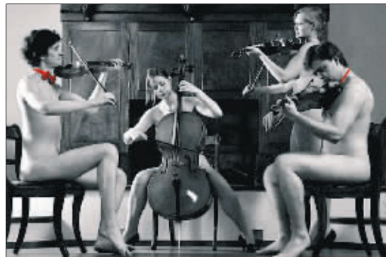
牛津学子的裸体“音乐会”

据英国《太阳报》6月9日报道,为帮贫困国家的学生筹款,一群牛津大学学生日前拍摄一组黑白裸体挂历,这一大胆的举动受到了英国媒体的广泛关注。