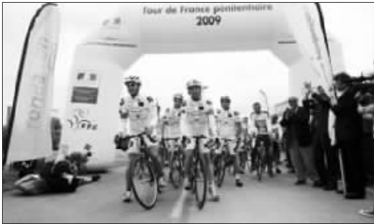
“越狱版”开幕式和真正的环法大赛开幕式几乎一模一样

囚犯也搞环法自行车赛,不是开玩笑吧?不,这是真的!本月4日,第一届囚犯环法自行车赛在法国北部城市里尔开幕,196个囚犯将在一周里环绕法国17个城镇骑行2300公里,然后抵达环法自行车赛的终点巴黎。