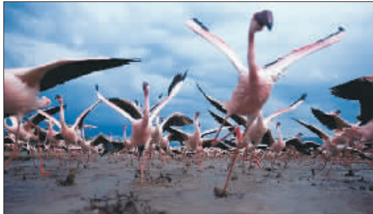
其余火烈鸟夺命狂奔

英国《每日邮报》网站6月8日刊登了一组鬣狗偷袭火烈鸟时惊心动魄的照片,这是英国摄影师阿努普·沙阿在肯尼亚首次使用将摄像机隐藏在火烈鸟群中的方法成功拍下的。