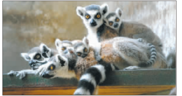
3个老婆“姐妹”情深,带着孩子挤在一起,一大家子其乐融融

“再不救出来,估计会被它们活活打死。只好让雄猴搬家,单独住到别的房间。”饲养员说,节尾狐猴家族还处在典型的“母系社会”,雌猴当家,雄猴的功能就是传宗接代,只有在发情期到宝宝出生之前,可以享受短暂的幸福生活,其他时候,它都生活在最底层,即使在红山现在是“一夫三妻”制,这个唯一的老公,也没