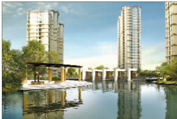
城中名宅雅居乐花园