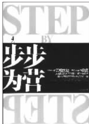
苍翠香调 著 中国商业出版社友情推荐