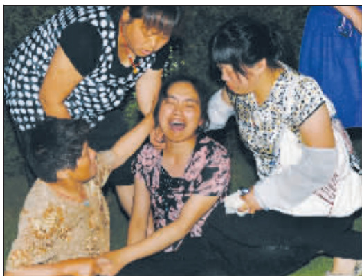
死者家属无法接受这一事实

昨天下午5点多,江宁区秣陵街道初级中学放学的时间,校门口人来人往。突然一名男学生被人架着从校园抬出来,男生浑身是血,胸口处衣服湿透。“快,快送医院!”随即他被抬上汽车匆匆离去。很快,几辆警车赶来,将另一名神情紧张的男孩带走。此时人们才知道,就在刚才,这名初一男生持刀捅了同学,不幸的是,这一刀要了那个孩子的命!