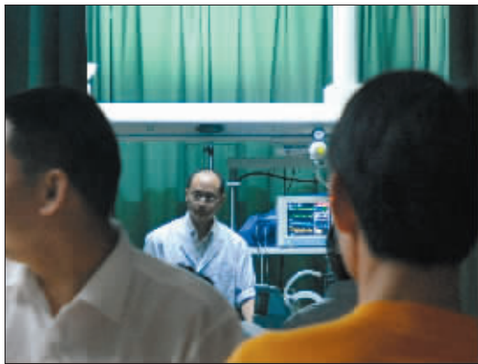
医生仍在做最后的努力