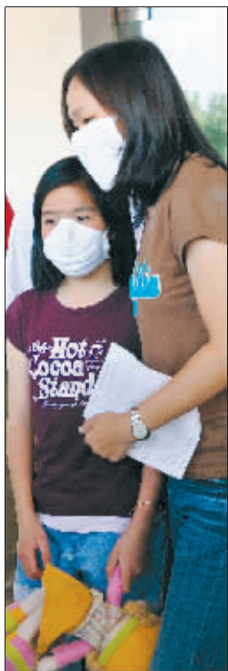
昨天下午,两位患者康复出院。通讯员 吴丹榕 快报记者 施向辉 摄