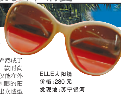
ELLE太阳镜 价格:280元 发现地:苏宁银河