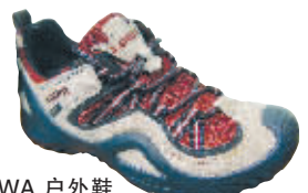
LOWA 户外鞋 价格:1780元 发现地:苏宁环球