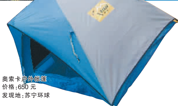
奥索卡户外帐篷 价格:650元 发现地:苏宁环球