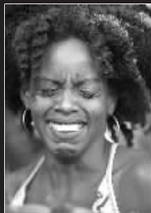
美国歌迷失声痛哭